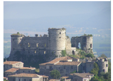
Il Castello di Vairano

Il quadro generale che ne viene fuori non è del tutto negativo anche se si evince una conoscenza ancora approssimativa e limitata delle ricchezze culturali del territorio, soprattutto dei nostri monumenti, della nostra storia e delle nostre tradizioni. Questa indagine vuole essere uno stimolo per la crescita di una migliore coscienza storica, morale, civica di tutti i nostri concittadini, perché un popolo che non conosce il proprio passato, non può salvarlo e non ha futuro!!